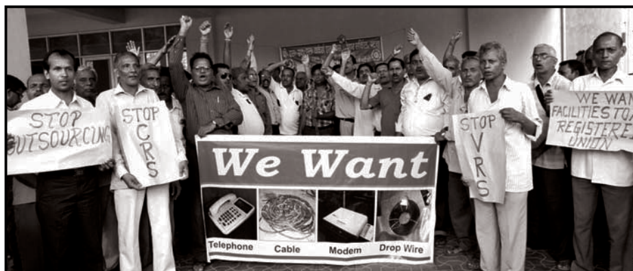
Demonstration of BSNL Workers at Patna

Be ready for sacrifice to protect the BSNL and its workers from the onslaughts of Govt. & BSNL Administration. ■