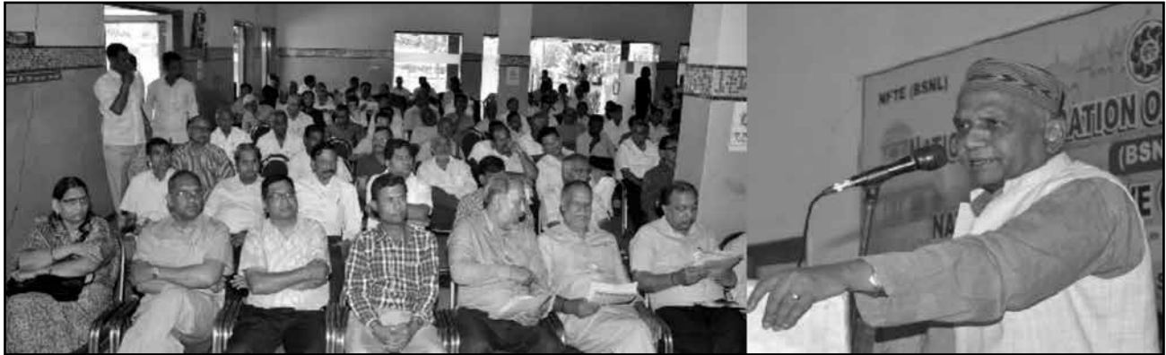
GS addressing the NE open session and seminar