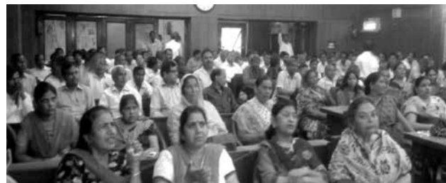
Audience at Meerut