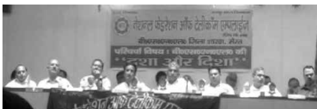
Dias view at Meerut