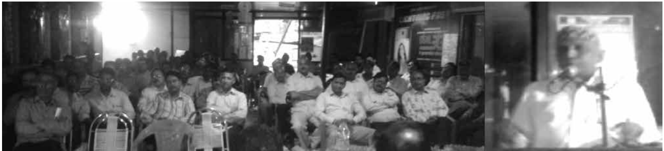
GS addressing the audience at Dehradun