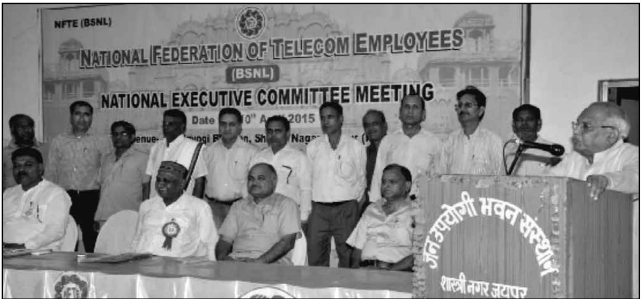
President addressing the opening session

cial crisis. Instead of extending help to the PSU the DOT officers are treating the BSNL as captive and dictating terms without discharging their own responsibilities in respect of the company. The union after deliberations decided to implement two days strike call of 21 st and 22 nd April whole heartedly against high handedness of Ministry of Telecom.