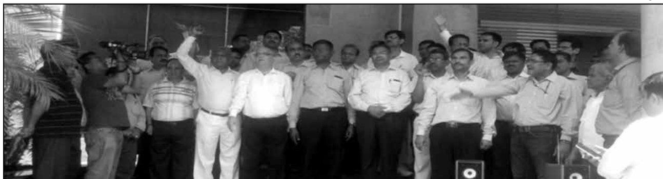
Central leaders at the gate of BSNL Hqr on 21st April