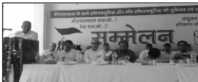
Dias view at Rewari