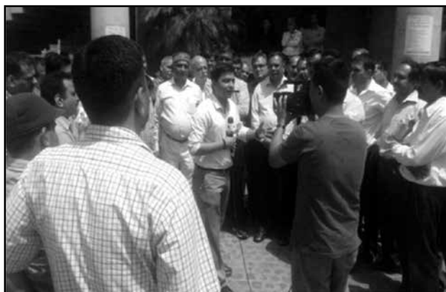
Assembled leaders and Comrades at BSNL Hqs.

It is expected the much publicised Govt of "Action" will read writings on the walls and will honour all their commitments, declarations and assurance made in the Parliament and in Media. NFTE once again records its deepest appreciations to BSNL staff and conveys greetings to them.