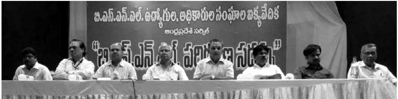
Leaders on the dias

operator's intention is profit orientation. After entering of BSNL into cell services call rates had come down from Rs.20/- to 0.20 paise. If the BSNL is not existing the private operators will had loot the general public. Speakers from all unions spoken about