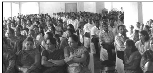
View of the audience