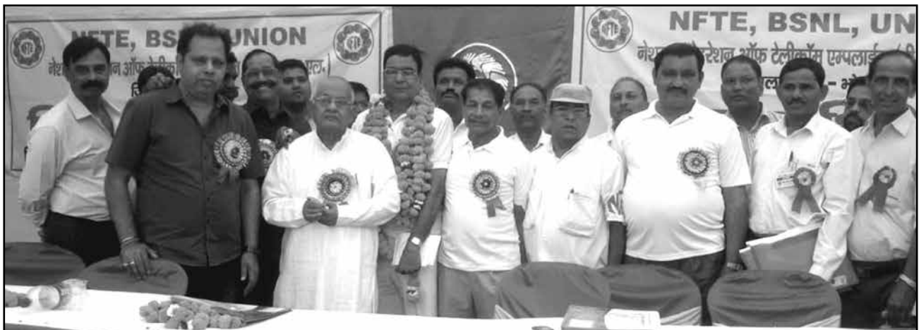
President with elected office bearers of Bhopal District union